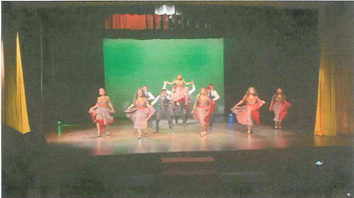
Grupo de Danza con Marimba RANIMA KIKEL KICHE, iniciativa ESPACIOS 2,022 Teatro de Cámara Hugo Carrillo