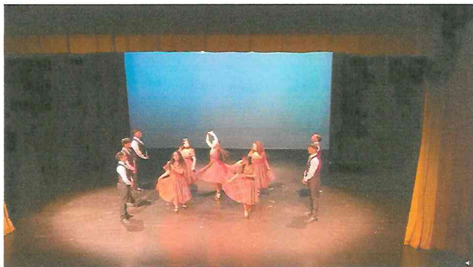
Grupo de Danza con Marimba RANIMA KIKEL KICHE, día tres de presentaciones miércoles 28 de septiembre 19:30hrshrs