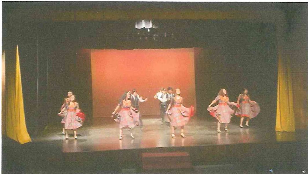
Grupo de Danza con Marimba RANIMA KIKEL KICHE, día cinco de presentaciones Viernes 30 de septiembre 19:30hrs