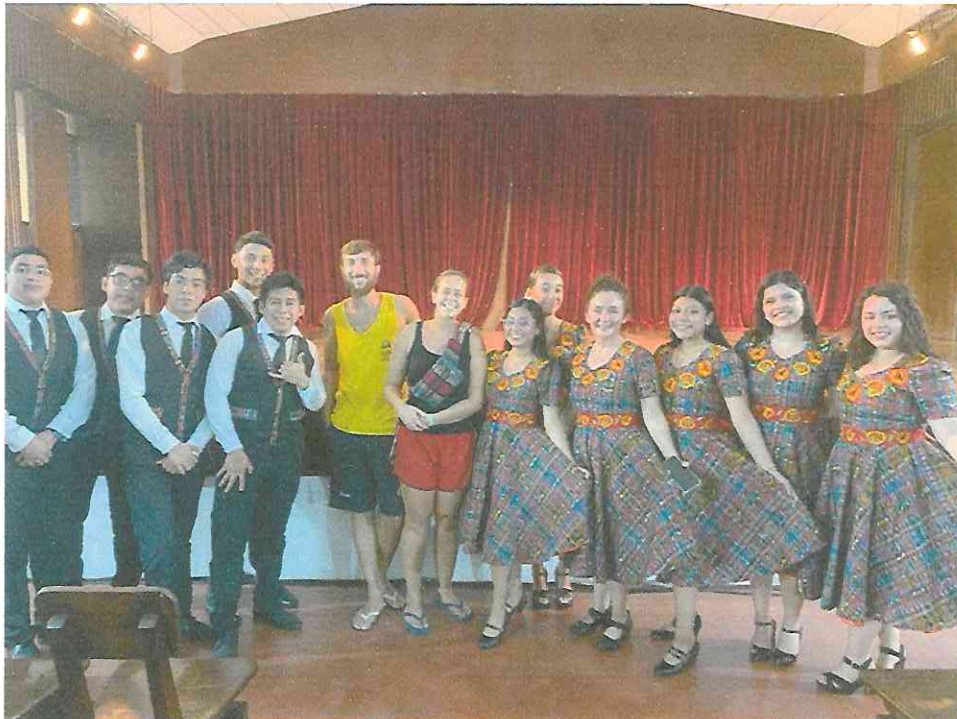
Final Segunda Presentación Grupo de Danza con Marimba Flores Petén, teatro municipal 25 de septiembre 2,022