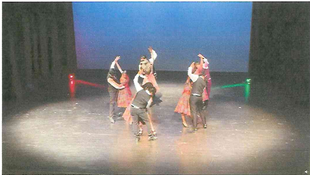
Grupo de Danza con Marimba RANIMA KIKEL KICHE, iniciativa ESPACIOS 2,022 Teatro de Cámara Hugo Carrillo