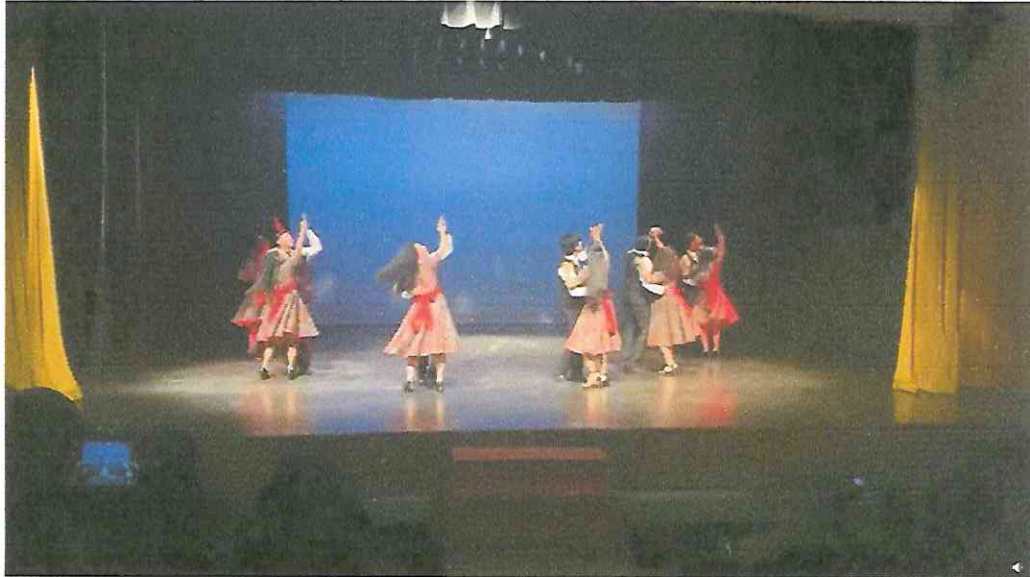
Presentación Teatro de Cámara Hugo Carrillo 30 de septiembre 2,022 Enlace de Prueba: https://www.facebook.com/SuramaLeila/videos/613981850222876