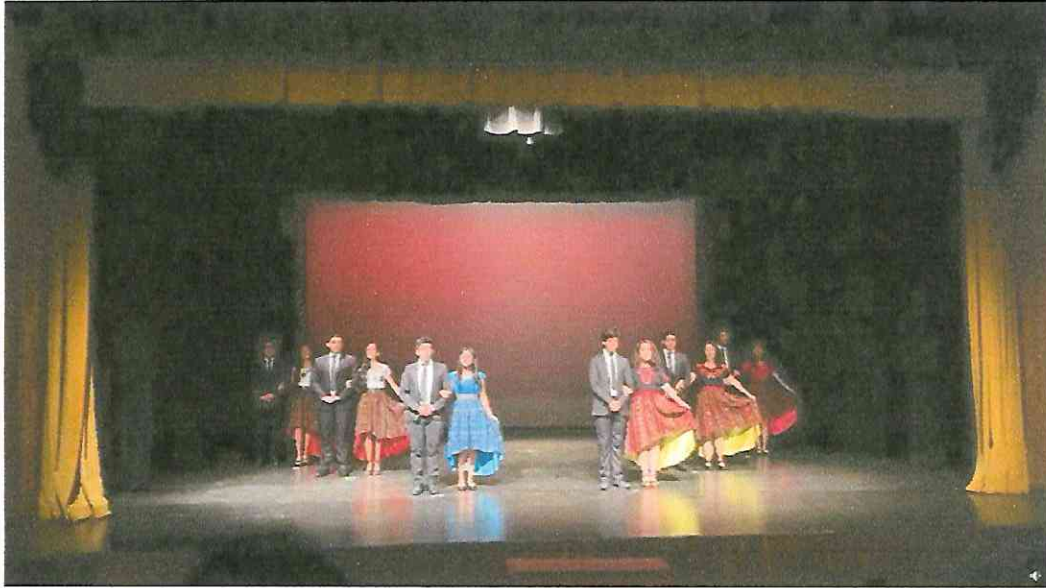
Presentación Teatro de Cámara Hugo Carrillo 29 de septiembre 2,022 Enlace de Prueba: https://www.facebook.com/SuramaLeila/videos/2462404770565653