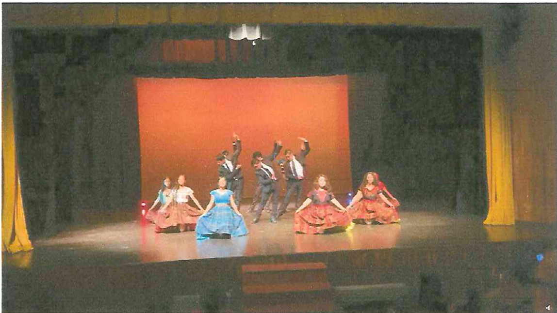
Final cuarta Presentación Grupo de Danza con Marimba Ciudad de Guatemala, teatro de cámara Hugo carrillo 29 de septiembre 2,022