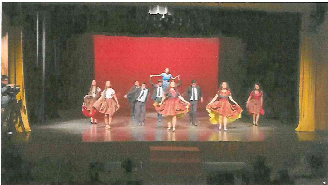
Grupo de Danza con Marimba RANIMA KIKEL KICHE, día cuatro de presentaciones jueves 29 de septiembre 19:30hrshrs