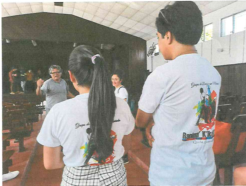
Ensayo Grupo de danza Ranima Kikel Kiche Teatro municipal de Flores Petén, ensayo general 2:30pm