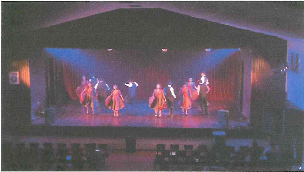
Grupo de Danza con Marimba RANIMA KIKEL KICHE, iniciativa ESPACIOS 2,022 Teatro municipal de Flores Petén.