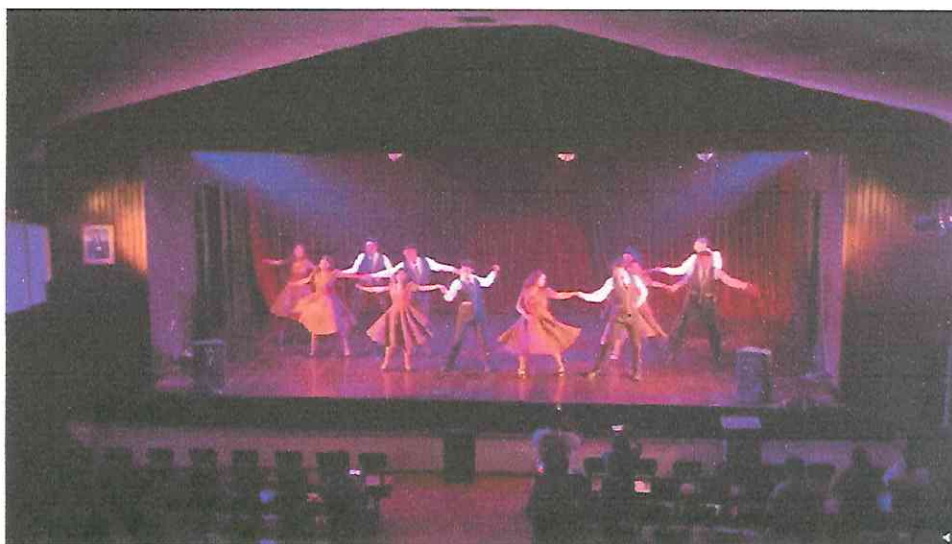
Grupo de Danza con Marimba RANIMA KIKEL KICHE, día dos de presentaciones Domingo 25 de septiembre 18hrs