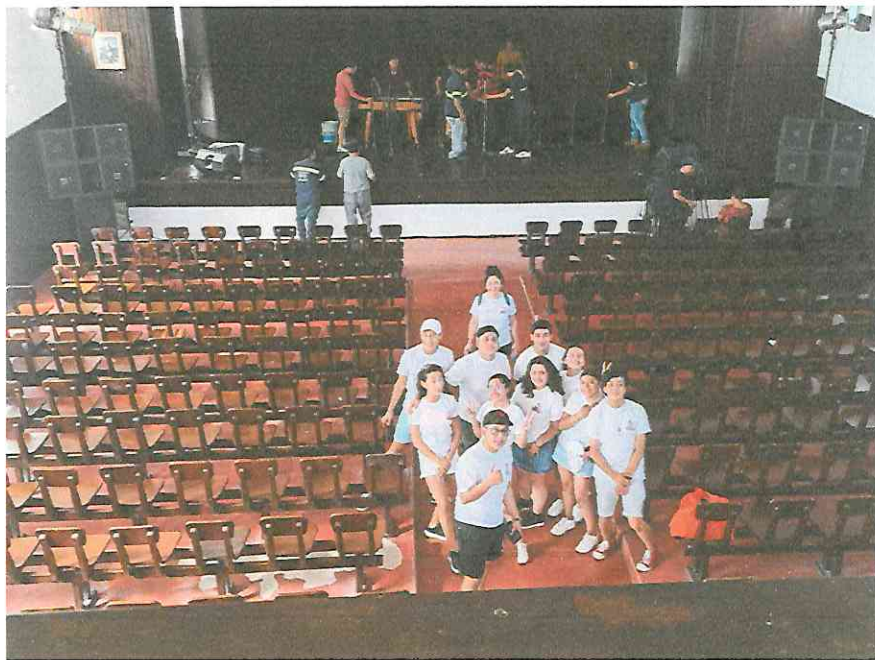
Teatro municipal de Flores Petén, ensayo general 2:30pm Sábado 24 de septiembre