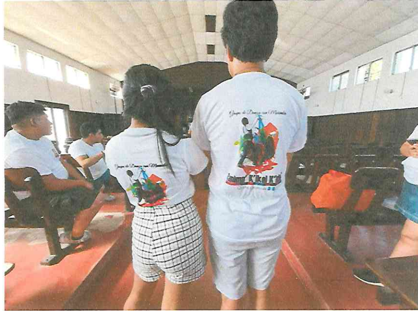
24 de septiembre, ensayo para las presentaciones de 24 y 25 de septiembre Teatro municipal de Flores Péten