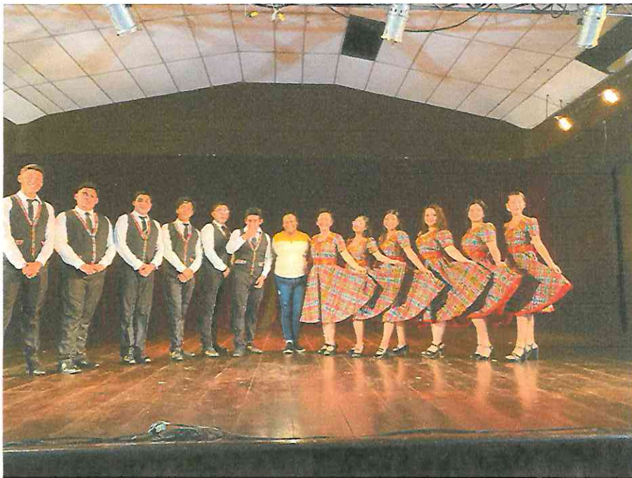
Final Primer Presentación Grupo de Danza con Marimba Flores Petén, teatro municipal 24 de septiembre 2,022