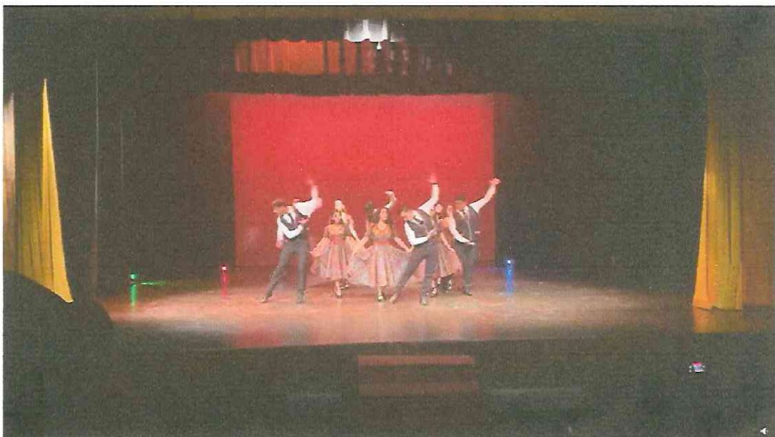
Final Quinta Presentación Grupo de Danza con Marimba Ciudad de Guatemala, teatro de cámara Hugo carrillo 30 de septiembre 2,022