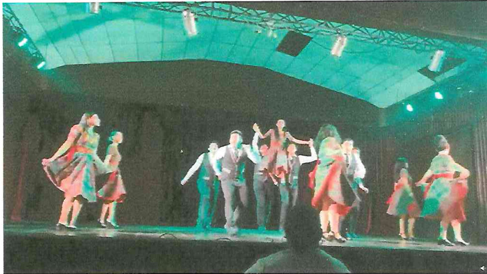
Grupo de Danza con Marimba RANIMA KIKEL KICHE, iniciativa ESPACIOS 2,022 Teatro municipal de Flores Petén.