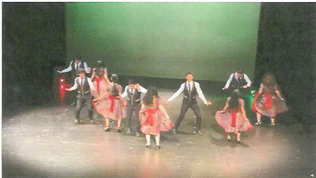
Final tercera Presentación Grupo de Danza con Marimba Ciudad de Guatemala, teatro de cámara Hugo carrillo 28 de septiembre 2,022