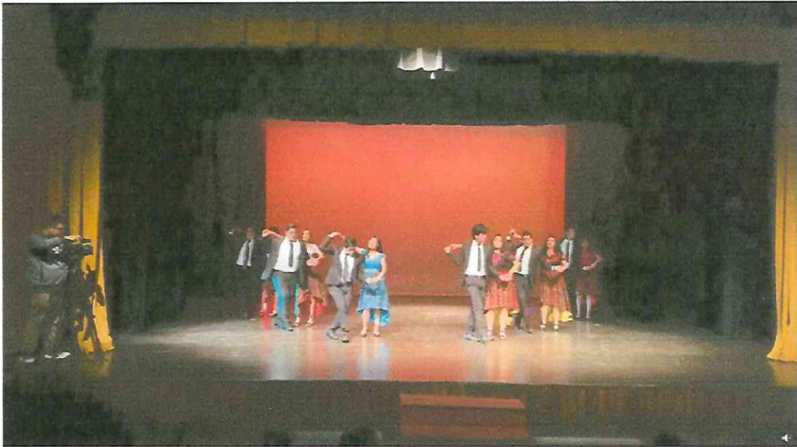
Grupo de Danza con Marimba RANIMA KIKEL KICHE, iniciativa ESPACIOS 2,022 Teatro de Cámara Hugo Carrillo