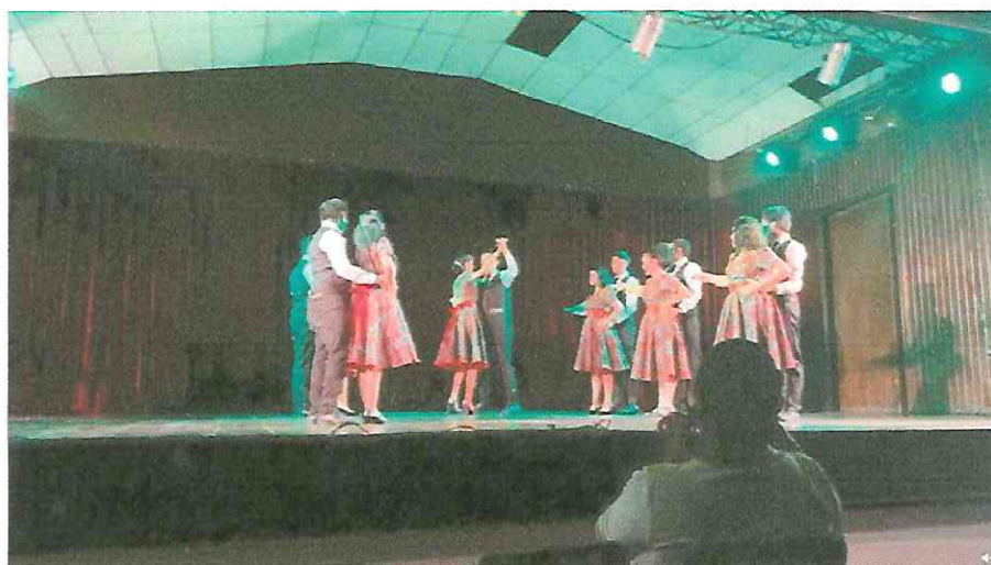
Primer día de presentaciones sábado 24 de septiembre, teatro de flores Petén